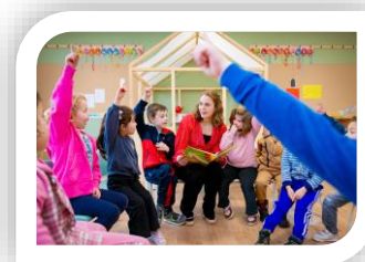
Kijkje in de groep

Ook als we beeldmateriaal voor een ander doel willen gebruiken, nemen we contact met u op. Ieder jaar opnieuw vragen wij uw toestemming. U mag natuurlijk altijd terugkomen op de door u gegeven toestemming.