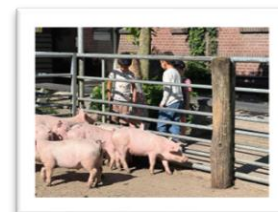
Naar de kinderboerderij