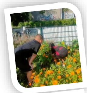
Werken in de moestuin