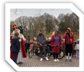
Sint en pieten op school

Er is een aantal teamleden op school opgeleid om hulp te bieden bij kleine en evt. grote calamiteiten.